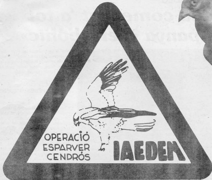
Aquest és l'emblema que la IAEDEN ha editat amb motiu de l'operació que pretén portar a terme