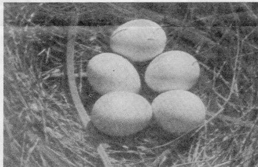
La posta d'ous comença la primera quinzena de maig i a finals de juny algunes cries ja fan el primer vol