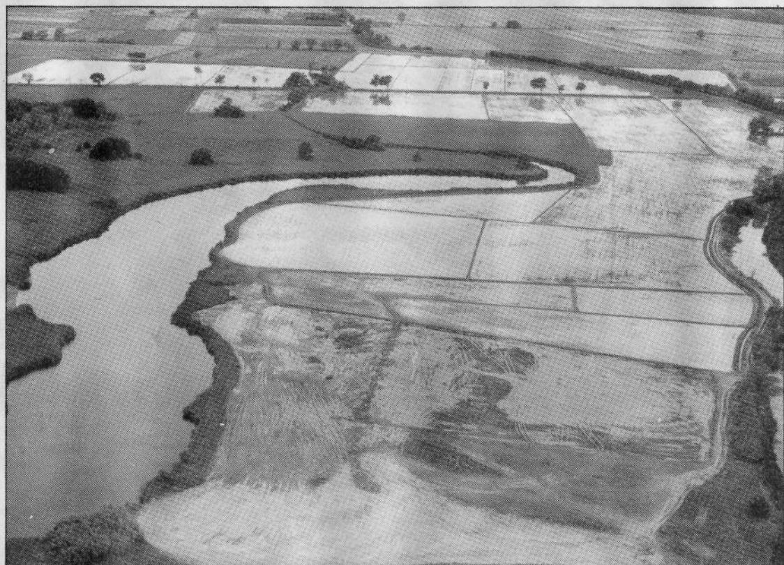
A la fotografia, vista aèria dels aiguamolls de Pals.