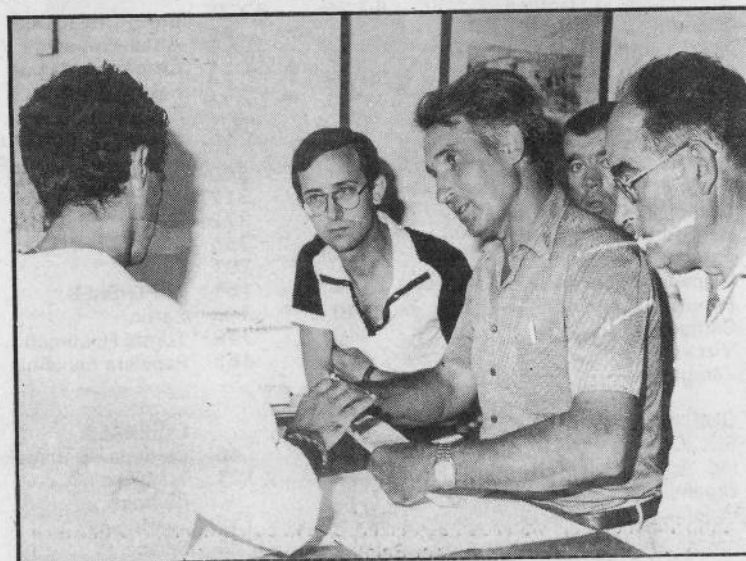
Els veïns lliuraren personalment les signatures a les oficines de l'Ajuntament.

El fet més significatiu però, és el que destacaren diversos membres del grup de veïns que presenta el llistat de firmes. «El Pla d'urbanisme ha servit perquè hagi nascut una oposició a l'actual govern municipal, que en ser l'única força política té les mans lliures per fer i desfer».