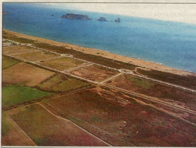
Aiguamolls. L'Ajuntament de Torroella vol recuperar la part enterrada.