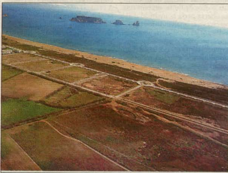
Aiguamolls. L'Ajuntament de Torroella vol recuperar la part enterrada.