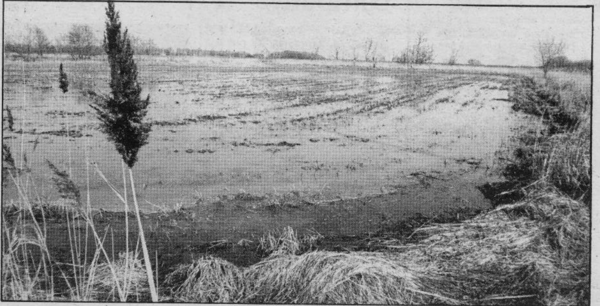
La construcció d'una marina residencial als discutits aiguamolls de Pals sembla molt positiva a la Cambra de Comerç de Girona.

L'informe destaca també que «s'ha de preveure que l'activitat turística, en general pressionarà sobre el medi ambient amb risc de la seva degradació unes vegades i d'altres amb efectes positius» i aconsella que «s'estableixi un conjunt de mesures concordants amb la política general escollida per aquest lloc, mesures que hauran de contemplar el mode d'utilització dels recursos ambientals i la protecció dels esmentats recursos».