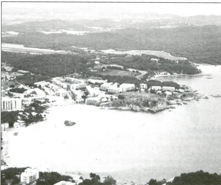
En primer terme les platges de la Fosca i Sant Esteve, totalment urbanitzades. Al fons, entre pinedes i conreus, el paratge de Castell.

Tal i com ja alguna vegada ho hem recordat, és tan senzill com entendre l'evidència de les grans decisions.