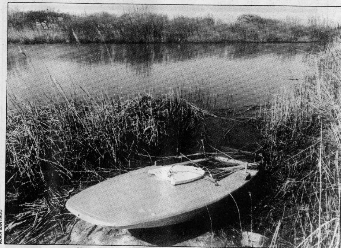
Una embarcació en una vora dels aiguamolls de Pals, ahir a la tarda.

La concreció del conveni queda pendent del que resolgui el Tribunal Suprem en el sentit de rati-