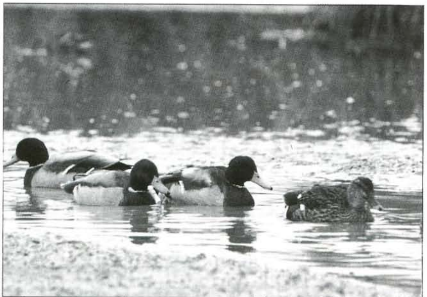
L'ànec coll-verd, dins del grup de les aus aquàtiques, és ben segur una de les peces més preuades pels caçadors.

L'actual situació del nostre medi ambient requereix actuar amb contundència i rigorositat en tots aquells fronts on es produeixen impactes i pressions innecessàries. I la cacera, malgrat que a molts els dolgui, és una d'aquestes activitats que provoquen erosions de les que ben bé ens podríem estar.